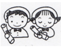
そつえん おめでとう がんばります

し頃クリスマスタイムに看護学生と共にグループで子供病院へ演劇慰問に出かけた事を思い出したひとときでした。毎週先生達は、保育終了後、時間を作って練習、会場準備、大道具、小道具の作製などかげになり、日なたになってチームワークのもと頑張る先生たちに改めて頭がさがる思いです、なんとと言っても子どもたちが幸せであるように！