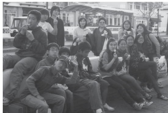
カタリナのアイスは、おいしいよ。